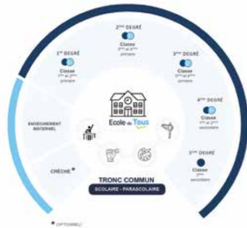
LE PARCOURS D'UN ENFANT DANS UNE ÉCOLE DE TOUS